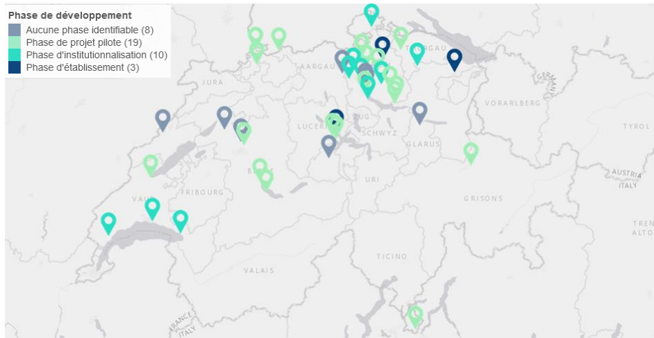
Figure 1 : En plus des 47 villes qui ont souhaité rester anonymes, ces 40 villes ont participé au Swiss Smart City Survey 2022.